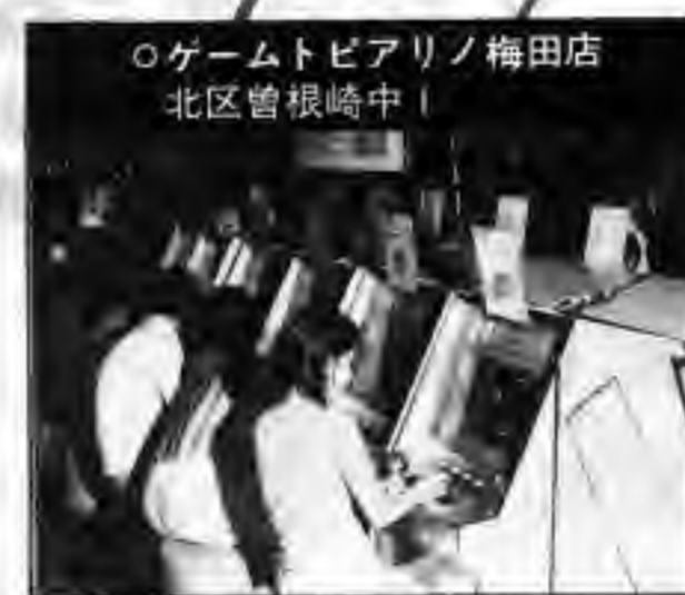
○ゲームトピアリノ梅田店 北区曽根崎中1