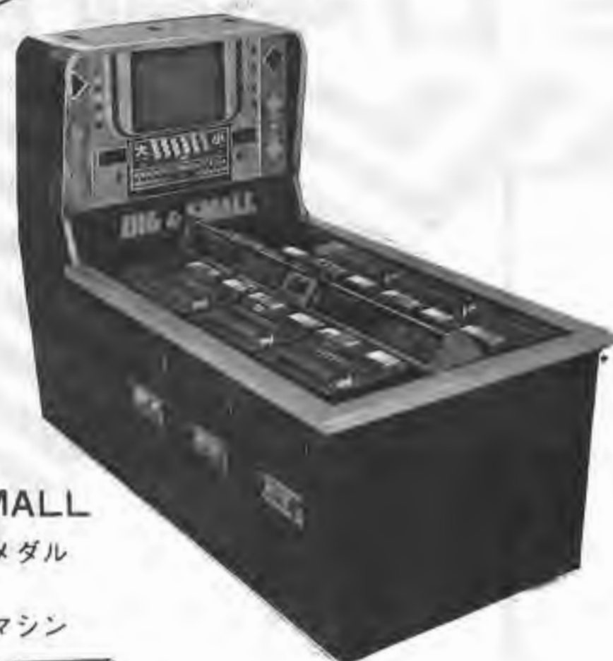
BIG & SMALL 大小の遊びをメダル ゲームに。 息の長い人気マシン