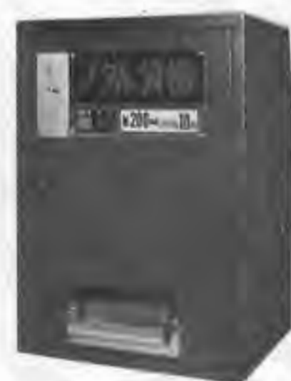
◀UNI 100 2~12枚までスライ ドSWで枚数調節。