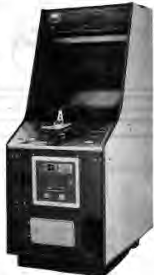
ロードチャンピオン・エス

「ロード・チャンピオン」は、先に発売された「ロード・チャンピオン」の画面のサイズを、二十センチから二十センチに変えたもので、遊び方は同じ。