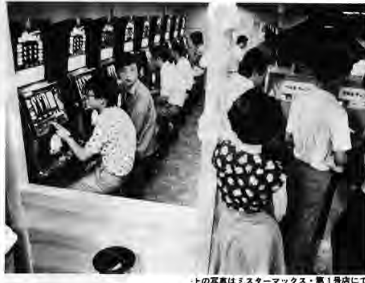
上の写真はミスターマックス・第一号店にて

スロットマシン型の風マックス(〇〇)がオープンした。このマックスは、旧来のオプティマ(本社)と異なり、新しいタイプの風マックスとして注目を集めた。オープンした日、大勢の客が訪れ、大賑わいだった。