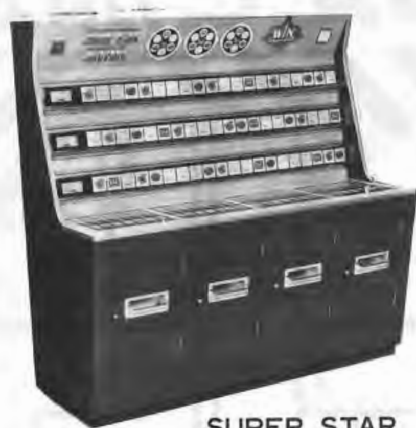
SUPER STAR リズムと組合せの面白さが 人気の秘密