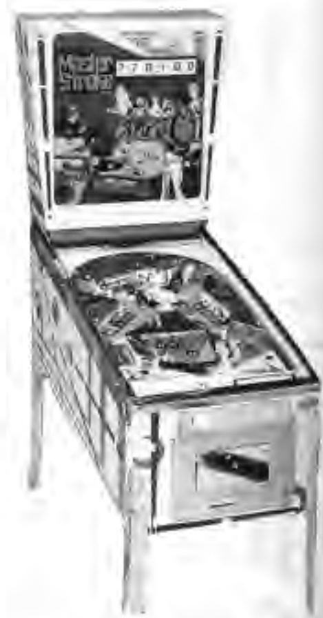
マスター・ストローウ

「ロード・チャンピオン」は、先に発売された「ロード・チャンピオン」の画面のサイズを、二十センチから二十センチに変えたもので、遊び方は同じ。