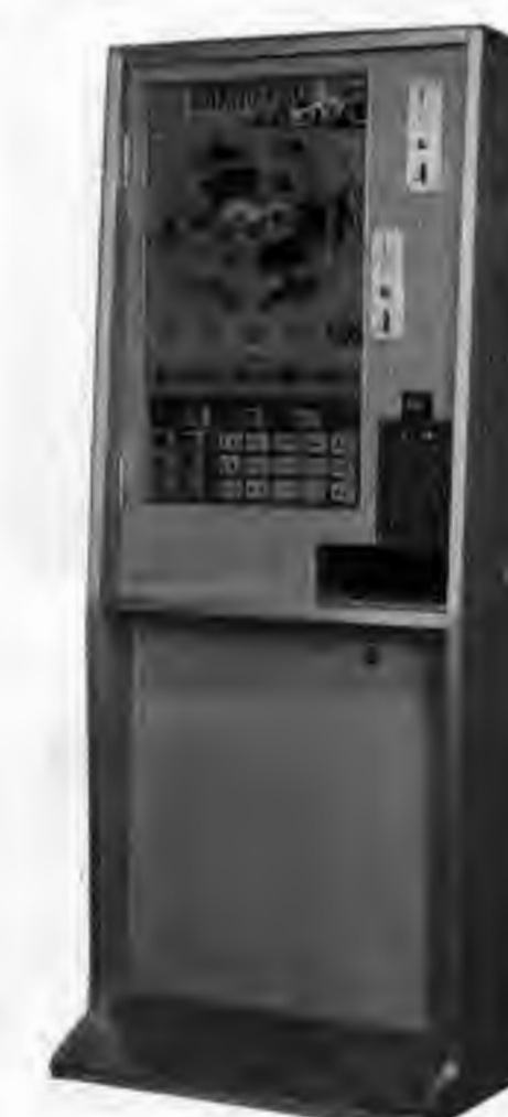
F-1 グランプリ (Aタイプ)