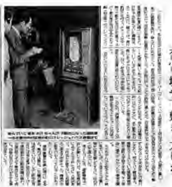
危険いっばい、幼児の周辺で遊戯機が倒れる

この事件を契機に、全日本遊園協会(JAA)ではAM部会(部長・松尾)が倒れた遊戯機(メダルゲーム機)の調査を開始し、各地の遊園地関係者に対して注意喚起を行っている。また、遊園地関係者からは、遊戯機の設置場所の見直しや、倒壊防止の対策が求められるなど、安全対策が急務となっている。