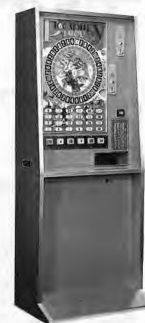
ニューピカデリーサーカスMK III