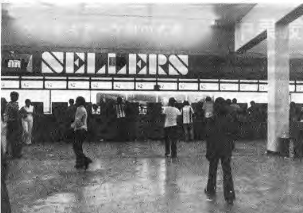
写真上は「犬券」売場、下はスタンドから見たトラック

開催日全レースの内、特定のレースのみこの賭け方ができる。この方式では、一着から三着まで、選んだ着順で入らなければならぬ。払戻しは異なる。今晩は第1.7.9レースにトリフェクタが行われる。