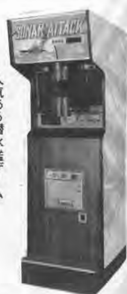
人気ある潜水艦ゲーム