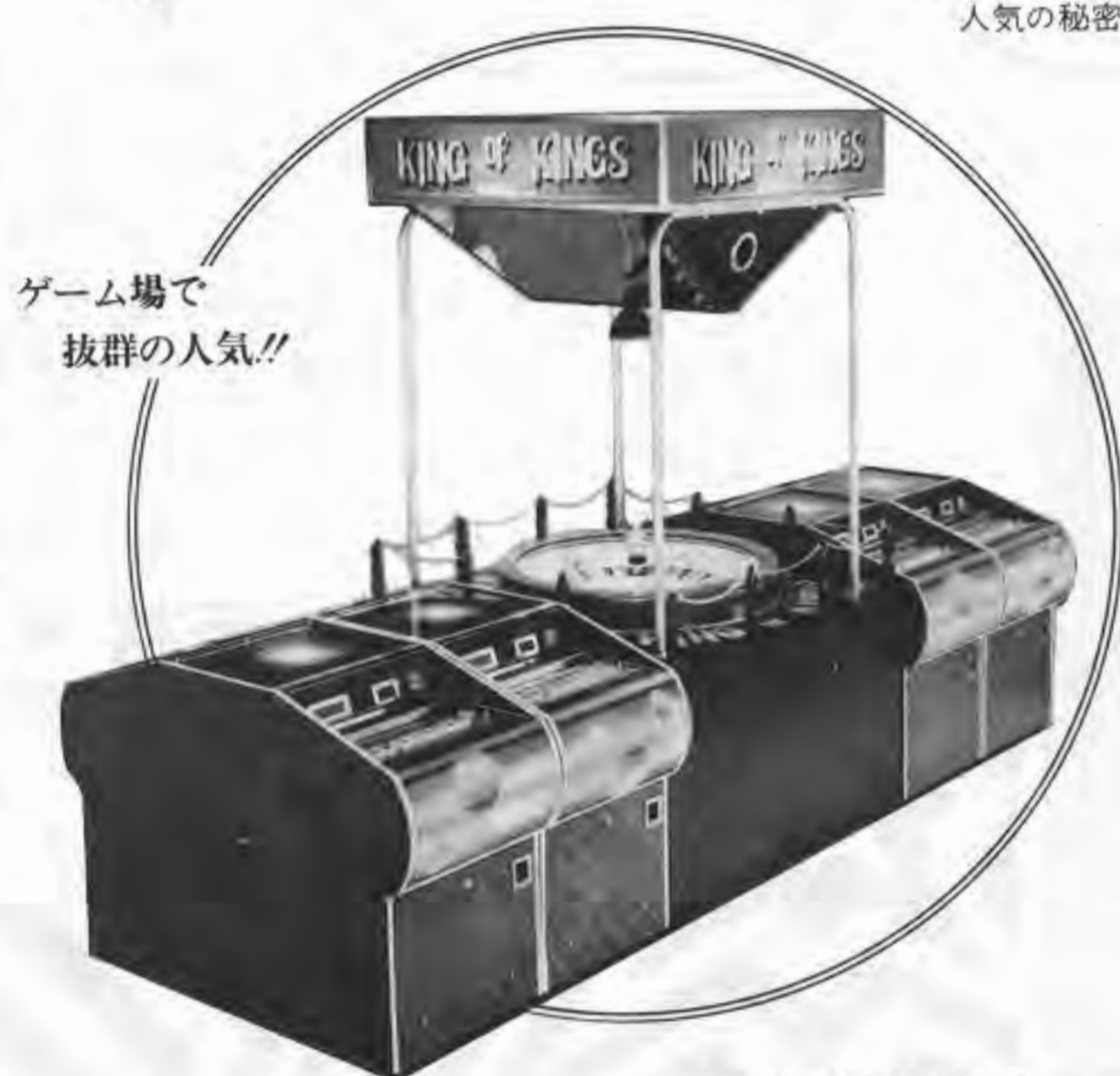
ゲーム場で 抜群の人気!!