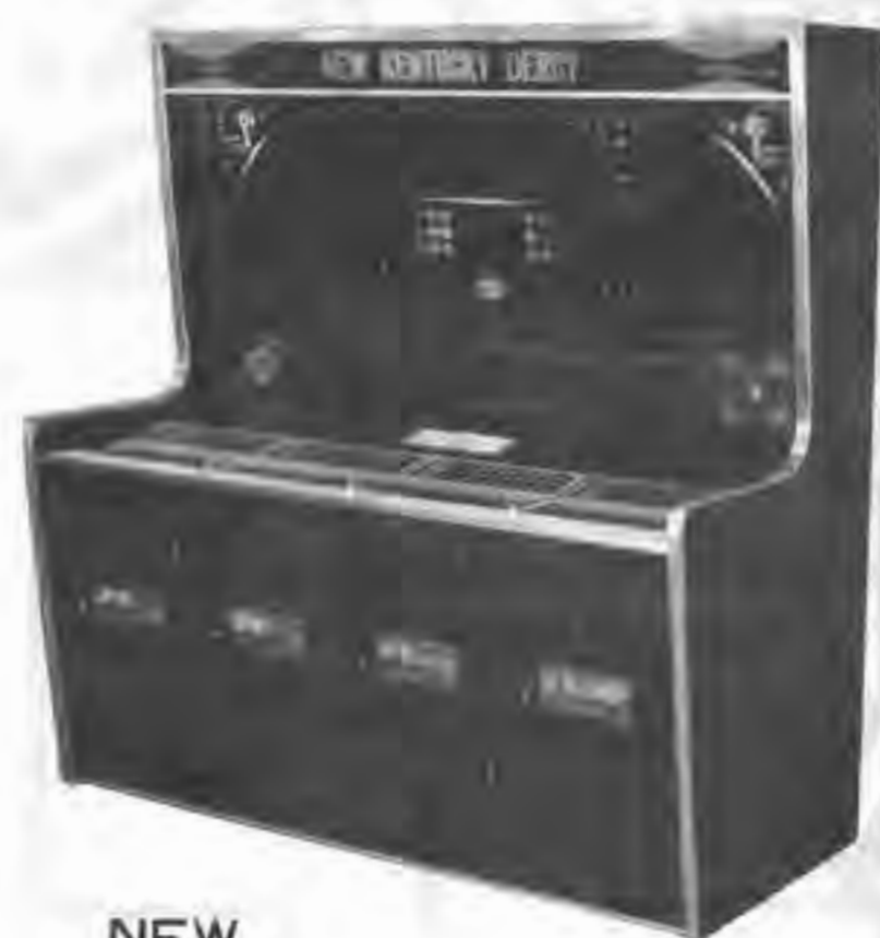
NEW KENTUCKY DERBY ゴージャスなムードのダービーゲーム