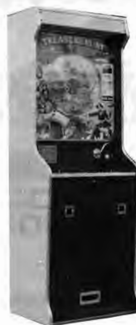
トレジャーハント