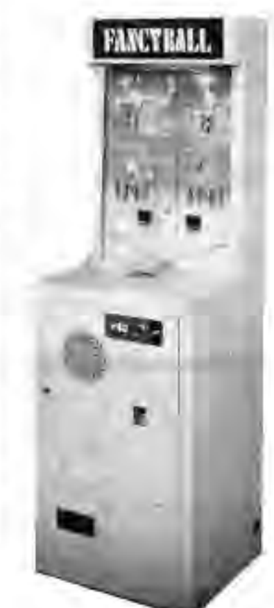
ファンシー・ボール