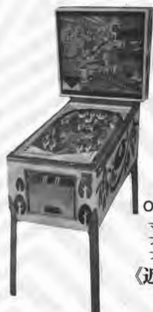
ORIENTEERING マイクロ プロセッサー使用の フリッパー