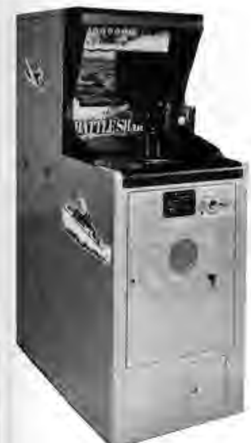
バトル・シャーク