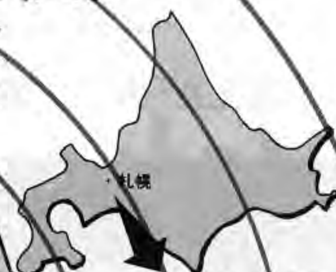
○ゲームプラザ ウィン 中央区南4条(第3グリーンビル)