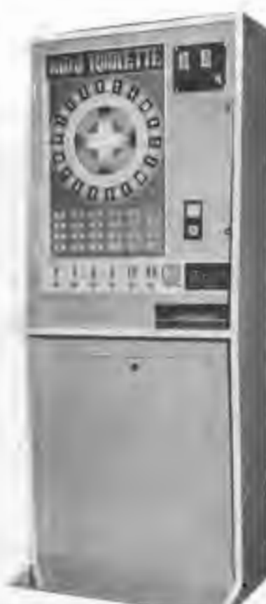
MINI-ROULETTE 豪華なキャビネットの ICマシン!!