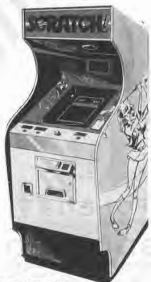
SCRATCH 壁を消していくスリリングなT Vゲーム。最高得点が自動的に 表示されます