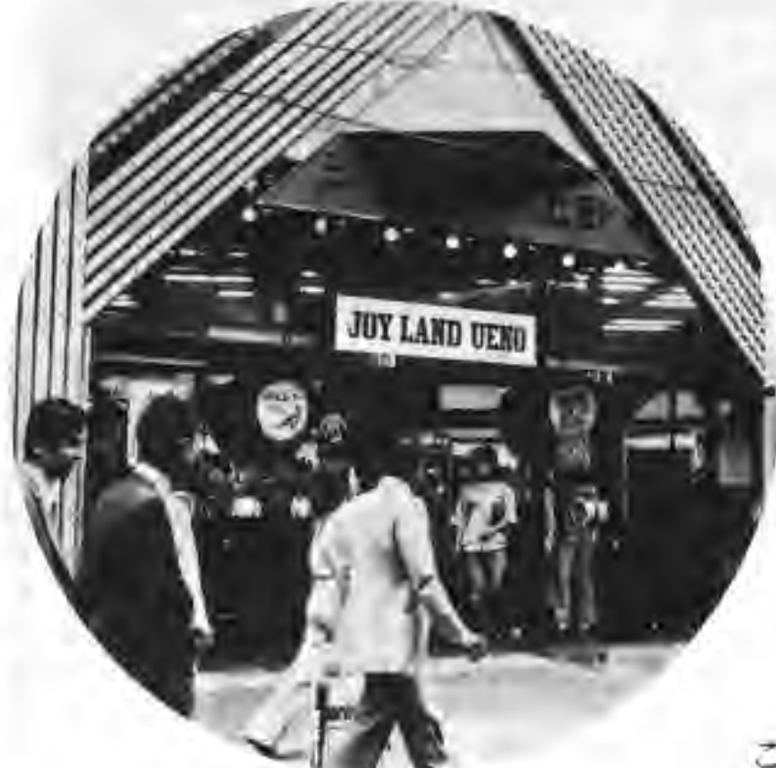
ジョイランド上野をのぞく