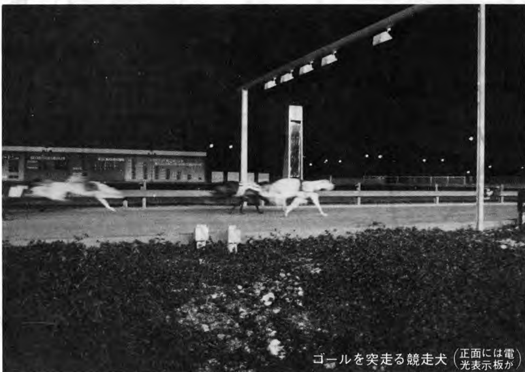
ゴールを突走る競走犬 (正面には電光掲示板が)