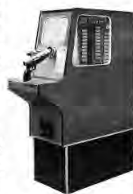
ガン・ファイター