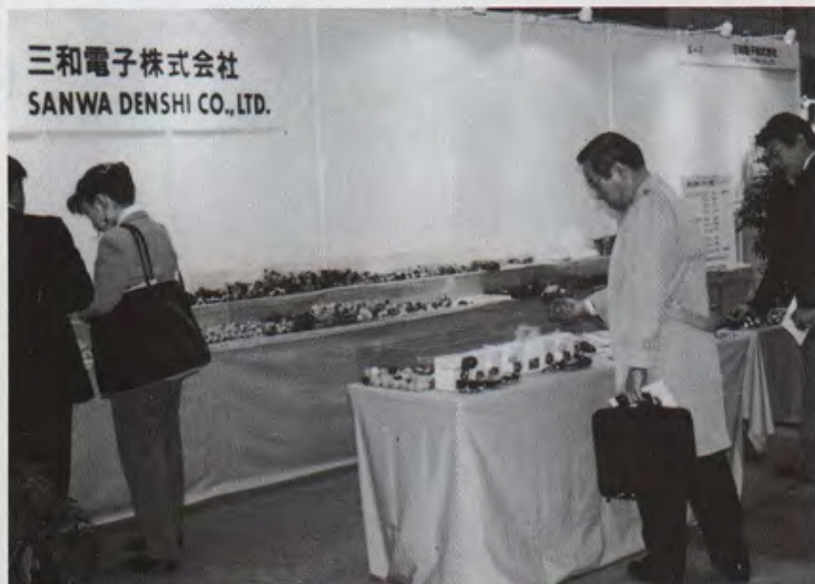
上の写真は押しボタンや電源の新作を展示した三和電子、下はコネクタや操作盤をメインに出品したセイミツ工業の小間