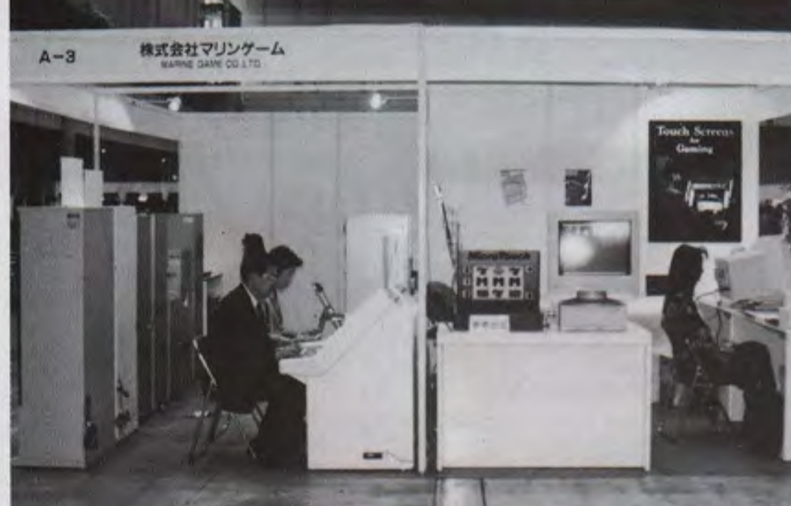
マリングーム (左) とマイクロタッチシステムズの小間

ハードメカ、部品は充実 景品類は多様化傾向に 部品関係はあらゆる業 務用ゲーム機が充足し、より使いやすいものへの改良が重ねられている。旭精工は、同社一連のハードメカや部品類に加え、リサイクル式識別機付き「AC-4000」、コンパクトな同「AC-5000」、TV機「L1000」を紹介。三和電子は、大型照光式ボタン「OBSA100UM」、7A用電源「SWIFT」、新ステッカー工業は、挿入式コネクタ、対戦台用ステッカー、操作盤の各新作を出品した。機用にも使える小型モーターを出品した。 景品類については、ライズマシンの多様化傾向に合わせ、景品専門業者が増え、種類も多彩になっている。アミューズは、パカボット、セントラル、ベミ取る、「つかみどりらんちやんの綿菓子機」など各種景品類を展示した。このほか、日邦産業が「キッズアドベンチャー・ドーム」、アトラスが自分の顔写真シールを作成し払い出す「プリン倶楽部」を出品し、自販機としてウェブシステム「キッズタワー」、セガ社「ボスター工場」、バンプレストのドーム内