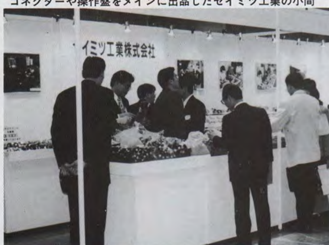
セイミツ工業株式会社