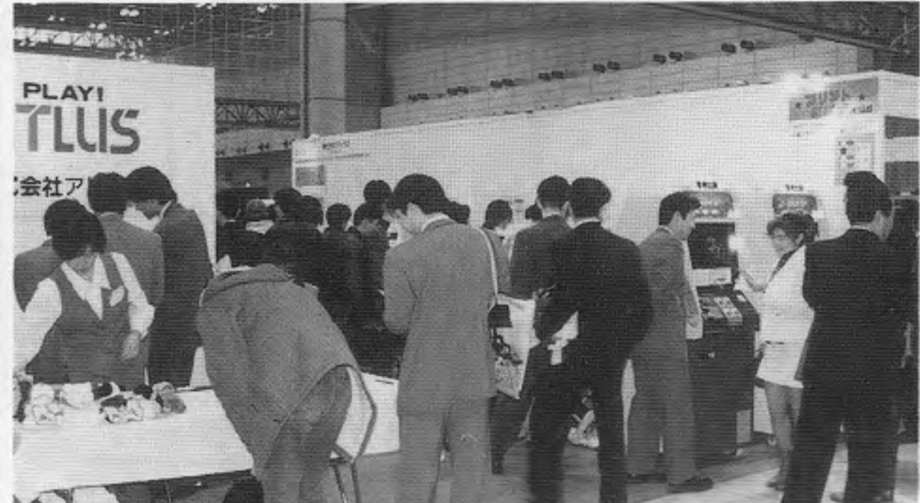
アトラスの小間にて、顔写真のシール自販機に人気が集まった