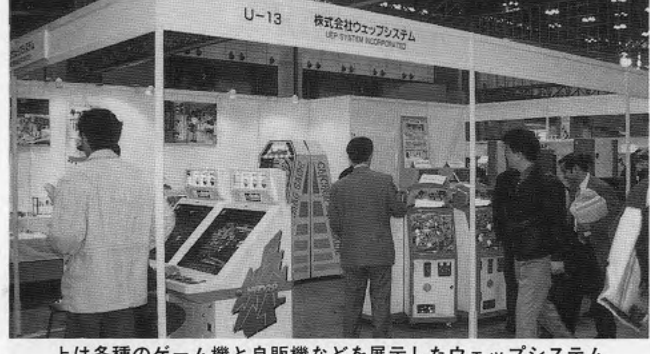
上は各種のゲーム機と自販機などを展示したウェブシステム