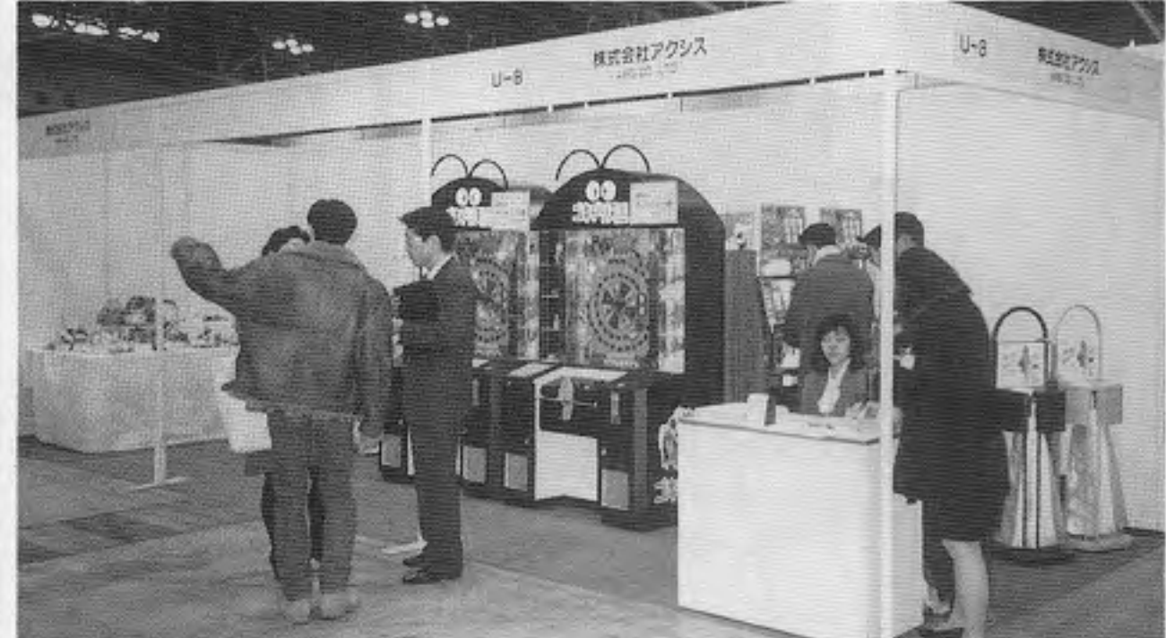
上は「ゴキブリ天国」などを出品したアクシスの小間のようす