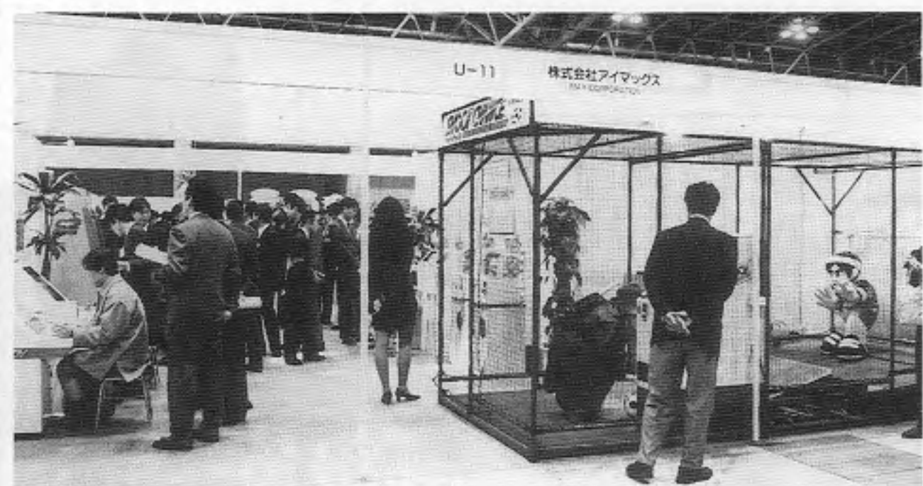
上の写真はアイマックスの小間で「シュートチャンス」などの展示部分