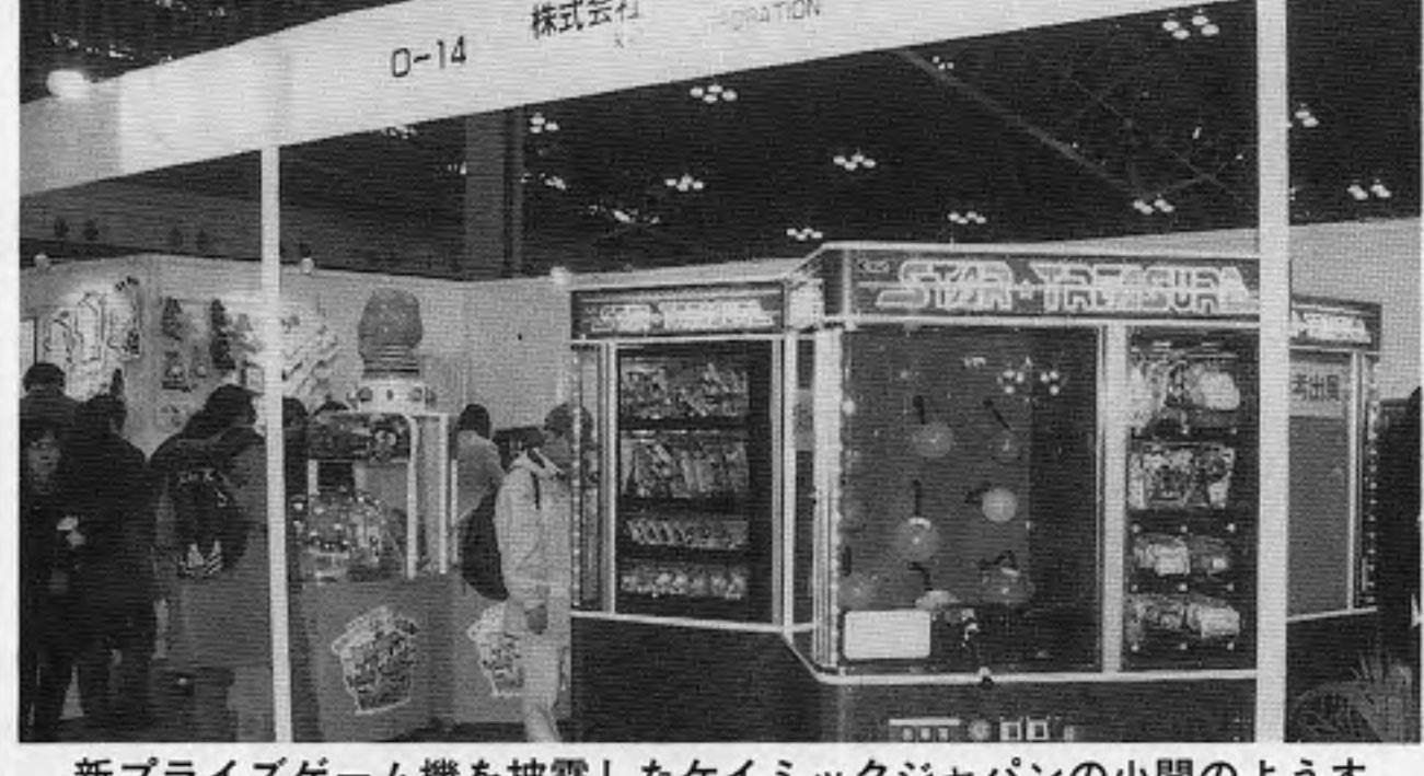
新プライズゲーム機を披露したケイミック日本の小間のようす