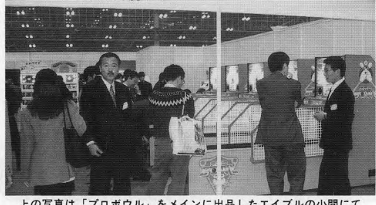
上は各種のゲーム機と自販機などを展示したウェブシステム