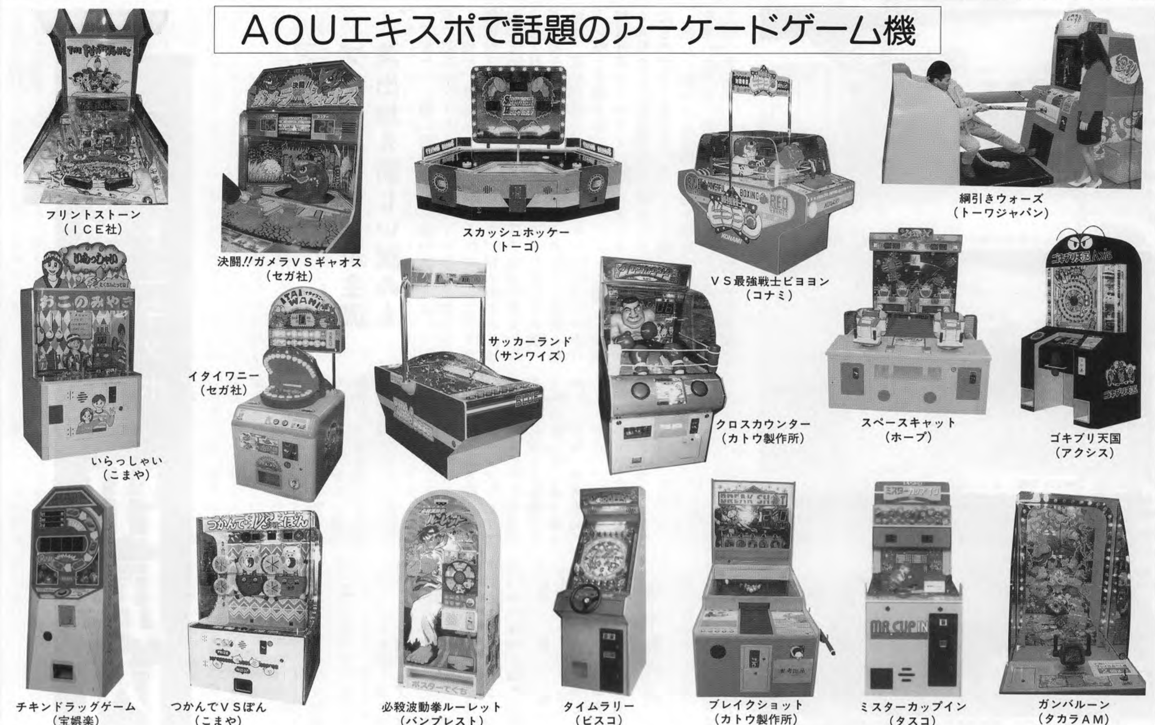
フロントストーン (ICE社) スクアッシュホッケー (トーゴ) VS最強戦士ビヨロン (コナミ) ゴキブリ天国 (アタシス) 決闘ガメラVSギャオス (セガ社) サッカーランド (サンワイズ) クロスカウンター (カトウ製作所) スペースキャット (ホープ) タイワニ (セガ社) いらっしやい (こまや) チキンドラッグゲーム (宝楽) つかんでVSぼん (こまや) 必殺波動拳ルーレット (バンプレスト) タイムラリー (ビスコ) ブレイクショット (カトウ製作所) ミスターカップイン (タスコ) ガンバレン (タカラAM)

サン電子 同社「バーチャルスポーツ」シリーズ「第二弾」の「バーチャルサッカー」を参考出品した。これはボールを百発スクリーンにぶつけるスクリーン射撃ゲームで、スクリーンの前にネットがある。 昭和鉄工 対戦サッカーゲーム機で、各選手に対応したミニレバー八本を操作しボールを運ぶ「サッカーランド」を参考出品した。 セガ社 「タイワニ」(参考出品)として、ハンマーで怪獣の頭を叩いて前進するのを阻止する「決闘ガメラVSギャオス」、ワニが口を開けた時に下の歯(ボタン)を押して、電光減速式「きんぐり」(参考出品)を披露した。 高田工業所 人相占い機「ミラリア」のソフト内容を充実