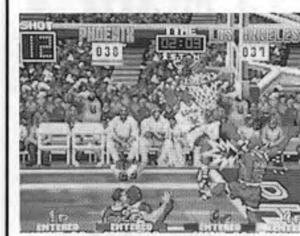
3オン3ダンクマッドネス

辰巳電子工業(本社奈良県橿原市、辰巳嘉宏社長)から、TVクイズ機「どうし手相なるの？」が四月下旬発売となる。これは手相と質問による回答をもとに、仮想の人生をシミュレートするゲーム。少しくらいの円形を置き、そのひらに直接レバーとボタンで名前入りをし、質問に答える。質問は「どうし手相なるの？」という遊びの要素を採り入れた新タイプのクイズ。人生体験マシンとして、作動時間は九十秒、最小回転半径は二・二メートル、ロビー付き。