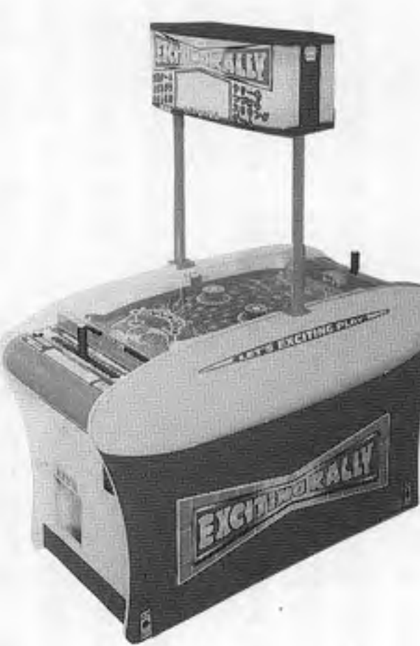
エキサイティングラリー

エイブル「くるりんチャンス」は、景品皿を傾けて景品を落とす4人用プライズマシン。景品は計八十個使用できる。四人用でOP価格百八万円。 これはボックス内で回転している四層のテーブルに乗せられた景品を、二つのボタンを使って落下させるもの。各テーブルは二十枚の四角い皿で構成され、一枚の皿に一個の景品が乗