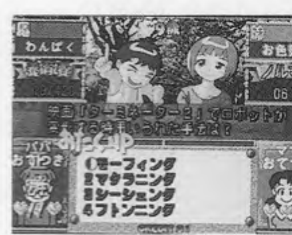
子育てクイズ・マイエンジェル2

Vクイズゲームのバージョンアップ版「子育てクイズ・マイエンジェル2」が四月二十日発売となる。また「黒ひげ危機一発」(ユージン製)が、四月下旬発売となる。 「マイエンジェル2」はクイズに答えながら子どもを成長させていくもので、前作の子どもの娘一人だったのが、「2」では男と女の双子になった。操作は四つのボタンを使用する。