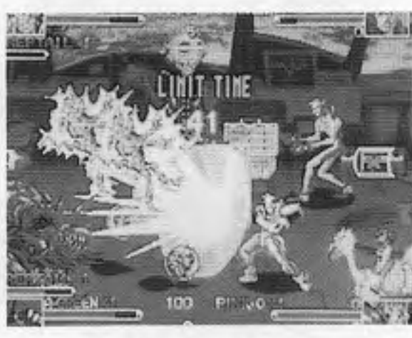
バトルサーキット

カプコン(本社大阪)が、アリア「ストリートファイターEXプラス」が四月四日発売となり、また「CPS II」第二十一弾ソフト「バトルサーキット」が、四月二十四日発売となる。 「ストリートファイターEXプラス」は、前作「EX」のバージョンアップ版で、前作では条件を満たさないと使えなかったボスキャラの「ベガ」と、「ガルド」、「隠しキャラ五人」が最初から使えるようになったことが最大の特徴。また特定のキャラに新しいスーパーコンボやワープ技などが追加されたほか、連続技などが攻撃面でバランス調整が加えられた。