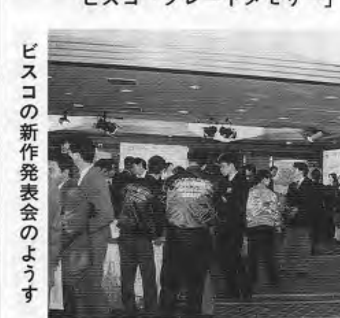
ビスコ「プレートメモリー」

ビスコ(営業所)は三月十日、東京・新宿の東京ヒルトンホテルで「プレートメモリー」を開き、新作展を開催した。