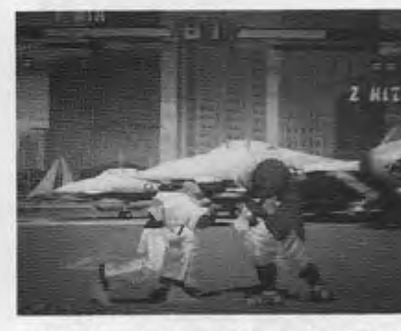
ストリートファイターEXプラス

八方向レバーと六つのボタン使用。基板OP価格十九万八千円。 「バトルサーキット」は近未来を舞台とした格闘アクションゲームで、五人のサイボーグキャラから一人を選び、奇怪な敵と戦う。画面は動きに反応し、最大四人まで同時協力プレイも可能。八方向レバーと二つのボタンを操作する。 攻撃システム面での主な特徴は、同時協力プレイ時に仲間全員が一定時間パワーアップし特殊能力が使える。「バトルロード」から、敵が落とすコインを集めて必殺技を買うことに強くなっている。また「バトルサーキット」は近未来を舞台とした格闘アクションゲームで、五人のサイボーグキャラから一人を選び、奇怪な敵と戦う。画面は動きに反応し、最大四人まで同時協力プレイも可能。八方向レバーと二つのボタンを操作する。