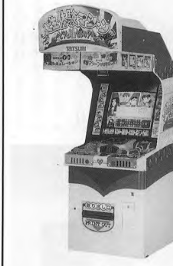
どうし手相なるの？

「どうし手相なるの？」は、手相と質問による回答をもとに、仮想の人生をシミュレートするゲーム。少しくらいの円形を置き、そのひらに直接レバーとボタンで名前入りをし、質問に答える。質問は「どうし手相なるの？」という遊びの要素を採り入れた新タイプのクイズ。人生体験マシンとして、作動時間は九十秒、最小回転半径は二・二メートル、ロビー付き。