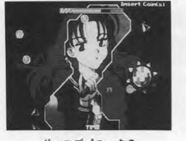
ギヤルズパニックS

カネコ(本社東京、金子浩社長)から、「ギヤルズパニックS」(「ノヴァ」を削除し四月名称変更)第五弾「ギヤルズパニックS」が四月下旬発売となる。これは「ギヤルズパニック」シリーズ五作目となるもの。敵の攻撃を避