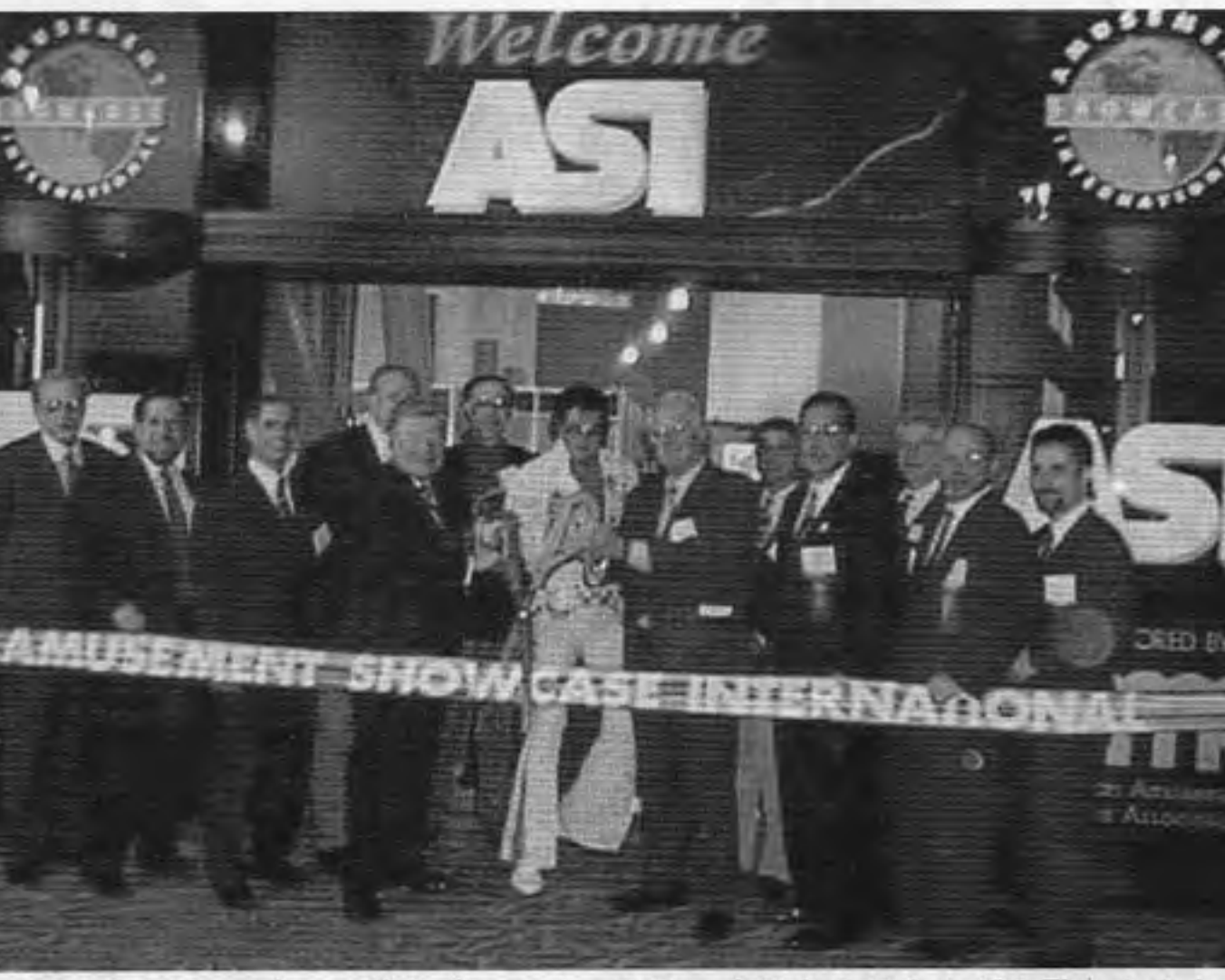
ASI'98のオープニングはプレスリーのそっくりさんがさん歌ったあと、例によって大きなハサミでテープカット。スピーチはない

「エイガイツ」までの新作を紹介。コナミ・オブ・アメリカ社は「スキャイズハイ」、「レーシンググライダー」、「バスアンブリア」、「ビートマン」までを出品した。