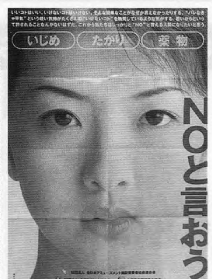
NO言おつ AOUが作成、会員（地方のオペレーター協会）に配付した「啓蒙ポスター」から。AOUはこのポスターについてよく広報していない。

「見えるショーから商 いのショー」という東 京おもちゃショー98の方 向付けもかわらず、 ビジネスショーになっ ていない」という意味の 「週刊玩具通信」明 四月十三日号の社説「明 日への主張」は指摘して いる。「見本市というも のは、一般的に業者対象 のビジネスフェアを指す 新製品を展示し、商品の 受注はするが、東京おも ちゃショーは、その一般 的なビジネスフェアとは 性格を異にしているよう だ。「おもちゃ」という 独特の業種であることが 「遊び」のエキスが