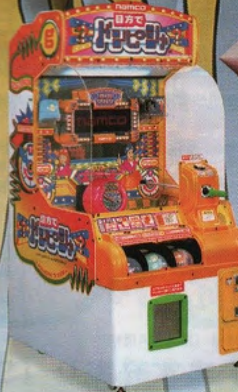
目方ドボンビジャ