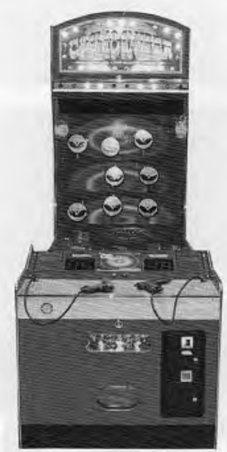
コスモスナイパー

コスモテック(本社茨城県猿島郡、館野野村社長)から、二人用エレベーター型ゲーム機「コスモスナイパー」が三月以降発売となる。これは備え付けのレーザービームを使用し、前方のエイリアンを狙撃していくゲーム。エイリアンのターゲットは、上中間の三段に計八つあり、目が光ったエ