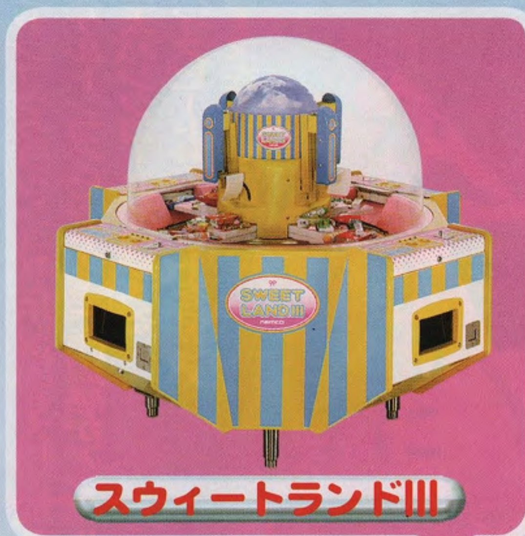
スウィートランドIII