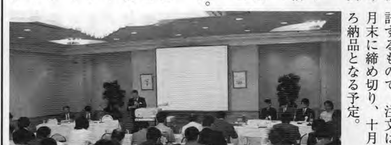
JAMMA・技術委員会による説明会で、下は「JVAアナライザ」

JAMMAの技術委員とを規定しているため、六月十日、東京・芝公園の芝パークホテルでその通信状況をテストする「JAMMAビデオ規格（JVS）第2版」および「JVAアナライザ」について説明会を開いた。これに会員メーカー二十社六十四名が出席した。JVSは業務用の汎用TVゲーム基板に関する規格として九六年十一月制定、九八年七月一部改定し「第2版」が作成された。また同規格はマイ基板とI/O基板に機械的に沿った基板設計をすることが長い目で見てリアル通信で接続すること