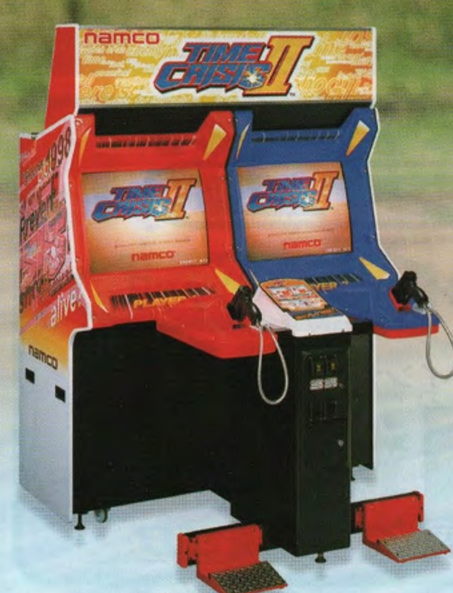
タイムクライシス2