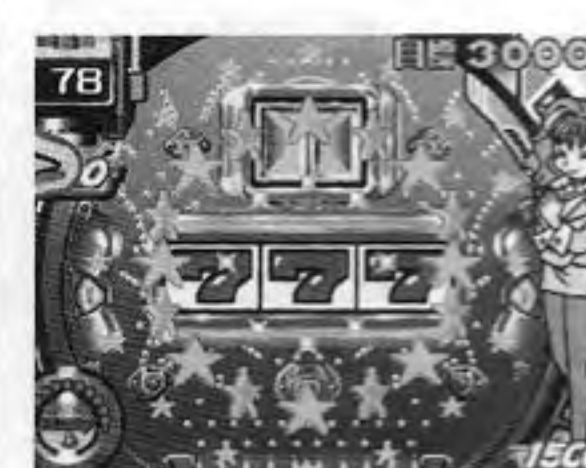
セクシーリアクション

セガ社「ニューアストロシティ」は、最大景品数は百六十個、設定され、周囲にランブルレットがある。ポスターでランブルが点滅し、各ユニットの側面の赤ランプで止めると、そのユニットの景品が落ちて払い出される。全体の原価率と景品単価を設定すると適正利益率を自動的に維持する機能を、リプレイを付加する(デイトップスイッチ)機能などもある。OP価格五十六万八千円。