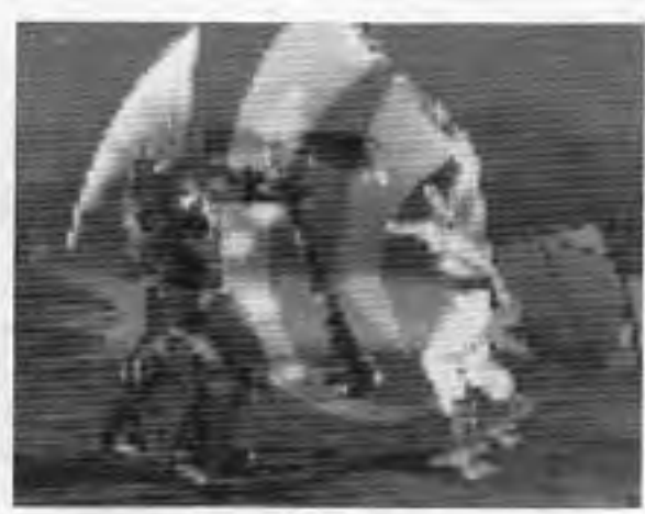
ソウルキャリバー

ナムコ(本社東京、中村雅哉社長)から、「システム12」によるCG武器格闘ゲーム「ソウルキャリバー」が、七月下旬発売となる。