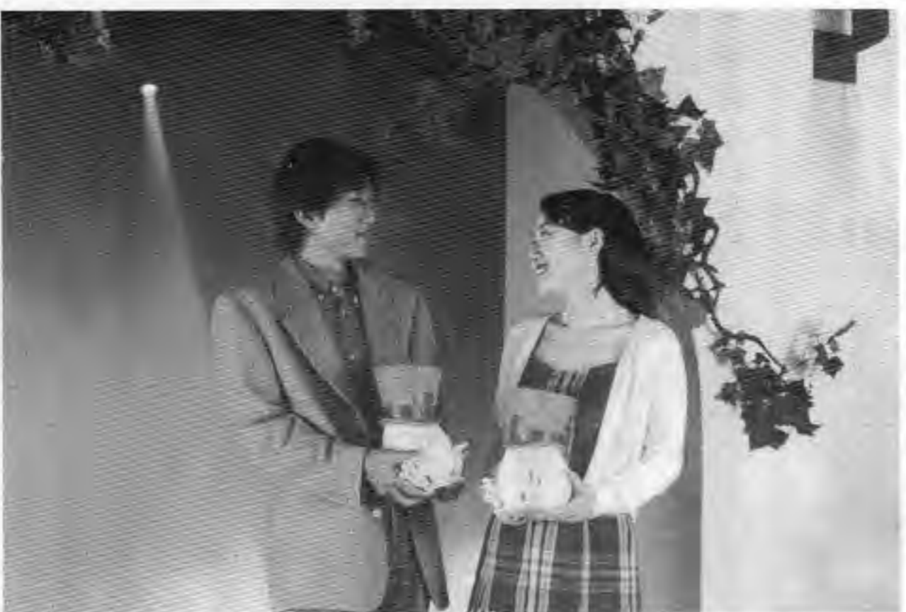
ナンジャタウンの新アトラクション「幸せの青い鳥」から

「未成年者喫煙禁止法」は明治三十三年（一九〇〇年）に制定され、四七〇年に一部改正された。この一世前の法律は、二十歳未満の者は煙草を吸ってはならないとし、この煙草の自販機を運営している者は「未必の故意」で煙草を販売した者は罰金に処される。煙草関係 「未成年者飲酒禁止法」は明治三十三年（一九〇〇年）に制定され、四七〇年に一部改正された。この一世前の法律は、二十歳未満の者は酒類を飲用してはならないとし、この酒類の自販機を運営している者は「未必の故意」で酒類を販売した者は罰金に処される。酒類関係