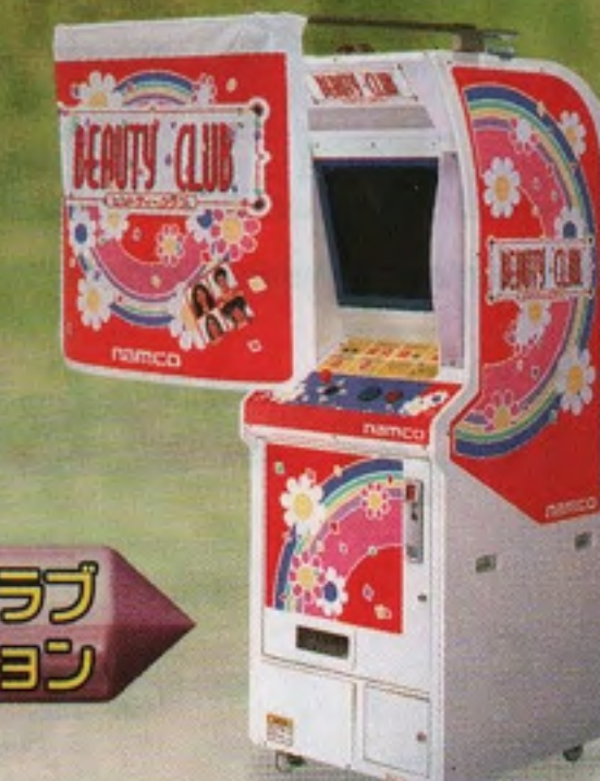
ビューティークラブ サマーバージョン