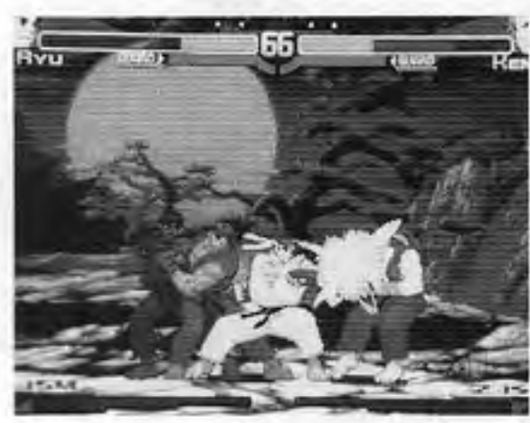
ストリートファイターZERO 3

弾となる格闘ゲーム「ストリートファイターZERO 3」が、七月十五日発売となる。これは前作に改良を加え、バージョンアップしたものが、キャラは前作の十八人に七人に加え、シリーズ最多の二十五人となり、さらに各キャラに個性を設定し、いづれかを選択する。また、キャラは事実上七十五種類となる。また、攻守シフトも追加された。八方向レバと六つのボタンを操作し、三タイプの個性は、一