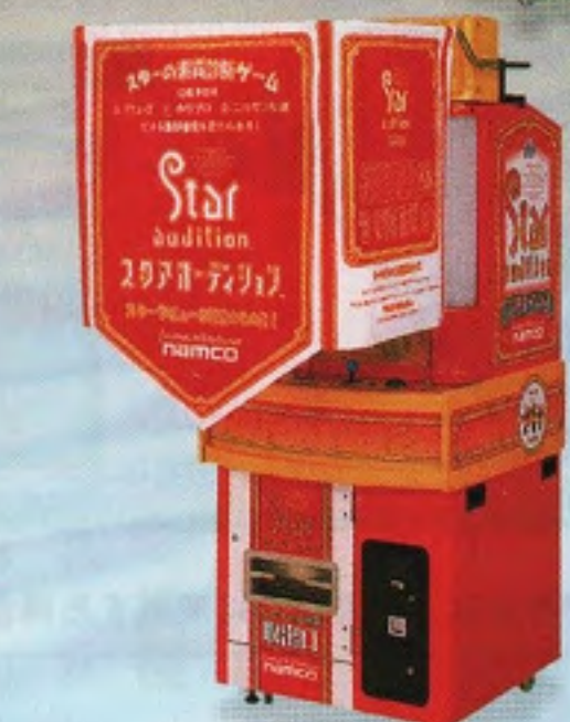
スタアオーデション