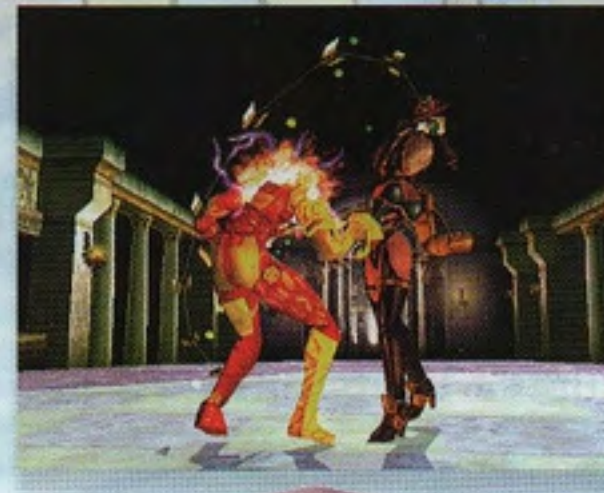
ソウルキャリバー