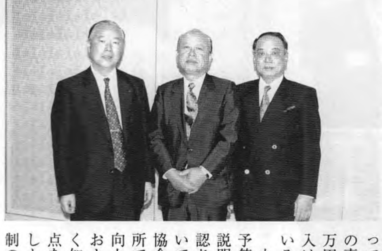
新任の真鍋副会長、入江会長、川橋副会長

今年一月に初めて発行された「公益法人白書」が、公益に関する事業とは、積極的に行なうべきであり、利益を追求することを目指す事業とは、公益法人の目的に反するものであると指摘している。 公益法人は、社会公益の増進を目的として設立され、その活動は公益に資するものであるべきである。公益法人は、社会公益の増進を目的として設立され、その活動は公益に資するものであるべきである。