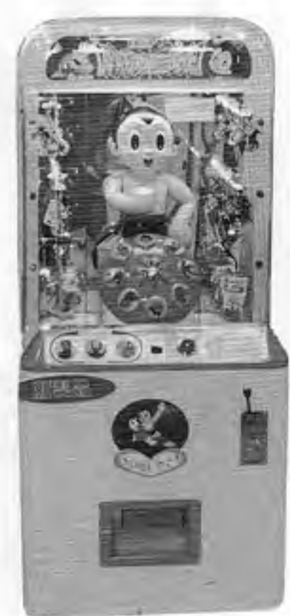
鉄腕アトムのパンチングルーレット

ジャレコ(本社東京、金沢義秋社長)から、ブクというもののボックスライズマシン「鉄腕アトムのパンチングルーレット」が四月上旬発売となった。これはボックス内に設置された「アトム」人形が右手を振り下ろし、回