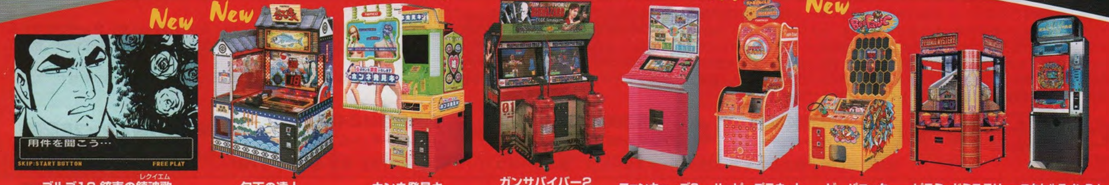
ゴルゴ13 銃声の鎮魂歌 (フリープレイ) 包丁の達人 ホンネ発見キ ガンサバイバー2 (バイオハードコード: ベロニカ) ファンキューブ2 ハッピープラネット ビーバック ピラミッドミステリー エクセルラインP (カトウ製作所製)

ナムコオンラインサービス インターネットで最新の製品情報をお知らせしています http://www.namco.co.jp/