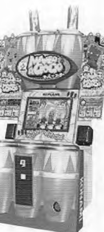
マンボ・ア・ゴー

コナミ(本社東京、上月景正社長)から、T.V.音楽ゲーム機「マンボ・ア・ゴー」が六月下旬発売となった。これはラテンパーカッションのひとつであるコンガをモチーフにしたもの