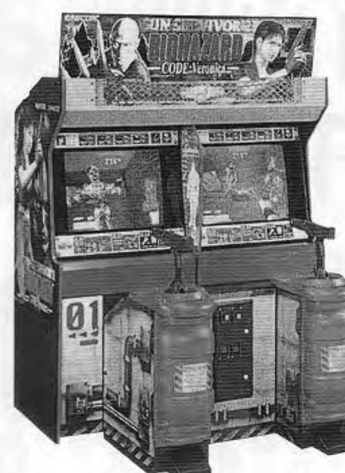
ガンサバイバー2 バイオハザードコード・ベロニカ

カプコン(本社東京、中村雅哉社長)から、カプコンとの共同開発によるCGガンゲーム機「ガンサバイバー2」が六月下旬発売となった。