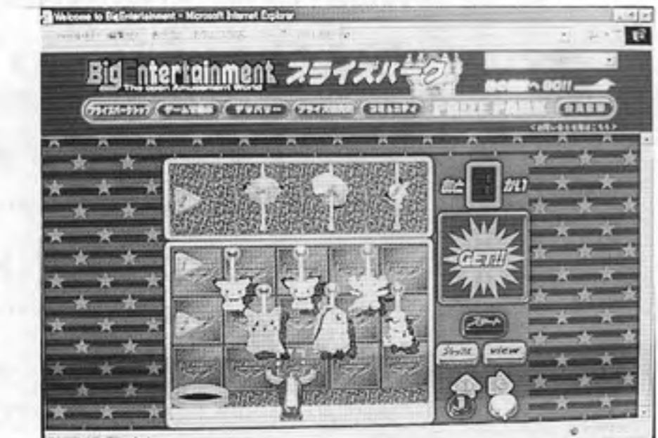
Cyber Arcade "Prize Park" Screen in Banpresto "Big Entertainment"

Banpresto Co., Ltd., Matsudo, Chiba, and Bandai Group officially opened on June 5 the cyber arcade "Big Entertainment" (www.big-e.ne.jp) on the internet. The site, which has been in trial operation since April 17, was put into full-scale operation after improvement of several points.