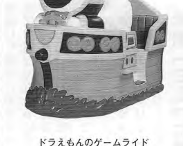
ドラえもんゲームライド