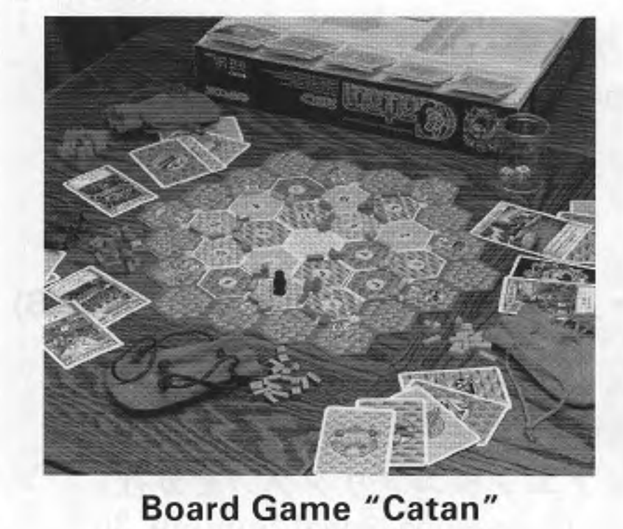
Board Game "Catan"

Adores Inc., Tokyo, announced that it will close down all operations of its large-scale horse racing game "Rongo Rongo" which has been a star game in medal game parlors. Launched nine years ago, the game has steadily become outmoded as the level of other horse racing games has risen. The first "Rongo Rongo" opened in October 1993 in Shibuya, followed by Ginza in April 1995 and Osaka in May 1996. The machine allowed up to 63-126 players to bet tokens on the same horse race and its large size meant that it required an entire building. "Rongo Rongo Shibuya" closed in June 2000, followed by Osaka in February 2002 and Ginza in March 2002. After Sigma was bought out by Aruze in February 2002 and became its subsidiary, Adores was formed as a result of the merger of Aruze's three subsidiaries, Sigma, Technical Management and Kan Design in October 2000.