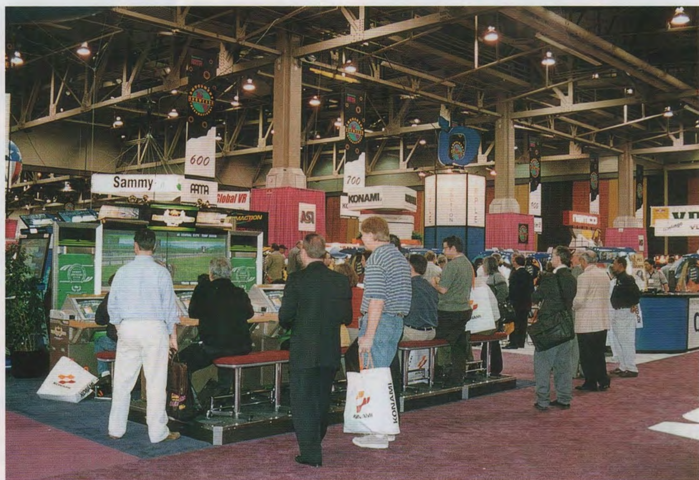
AS I 02展示会場の入口付近で、セガUSA社、アップルインダストリーズ社など並んでいるところ

米国の春の業務用AM機展、AS I (アミューズメント・ショー ケース・インターナショナル、旧ACME) 02が三月六・八日、ラスベガスのコンベンションセンターの一部で開催され、日米欧韓のTVゲーム機など新作が紹介された。欧州の英国ATEI、日本のAOUEキスポなどで披露されたものが多かった。