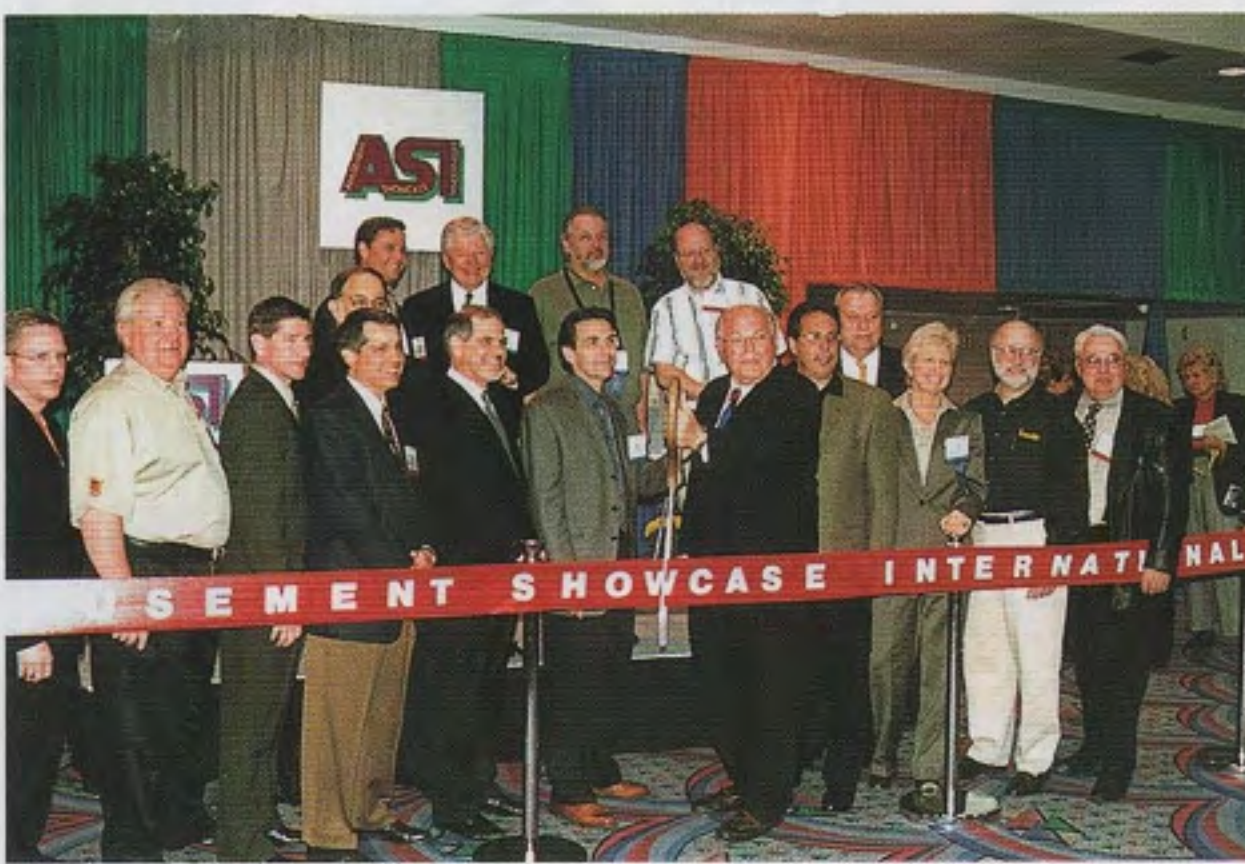
AAMAの役員が揃ってのAS I 02開会式。ハサミはひとつだけだ

米国の春の業務用AM機展、AS I (アミューズメント・ショー ケース・インターナショナル、旧ACME) 02が三月六・八日、ラスベガスのコンベンションセンターの一部で開催され、日米欧韓のTVゲーム機など新作が紹介された。欧州の英国ATEI、日本のAOUEキスポなどで披露されたものが多かった。